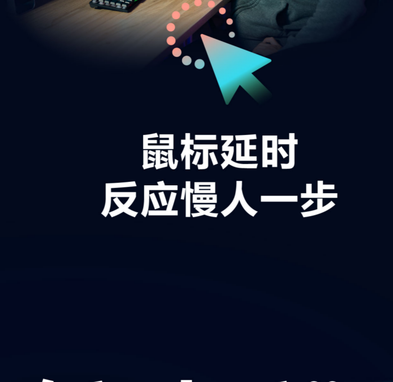
鼠标延时 反应慢人一步