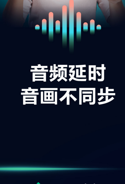
音频延时 音画不同步