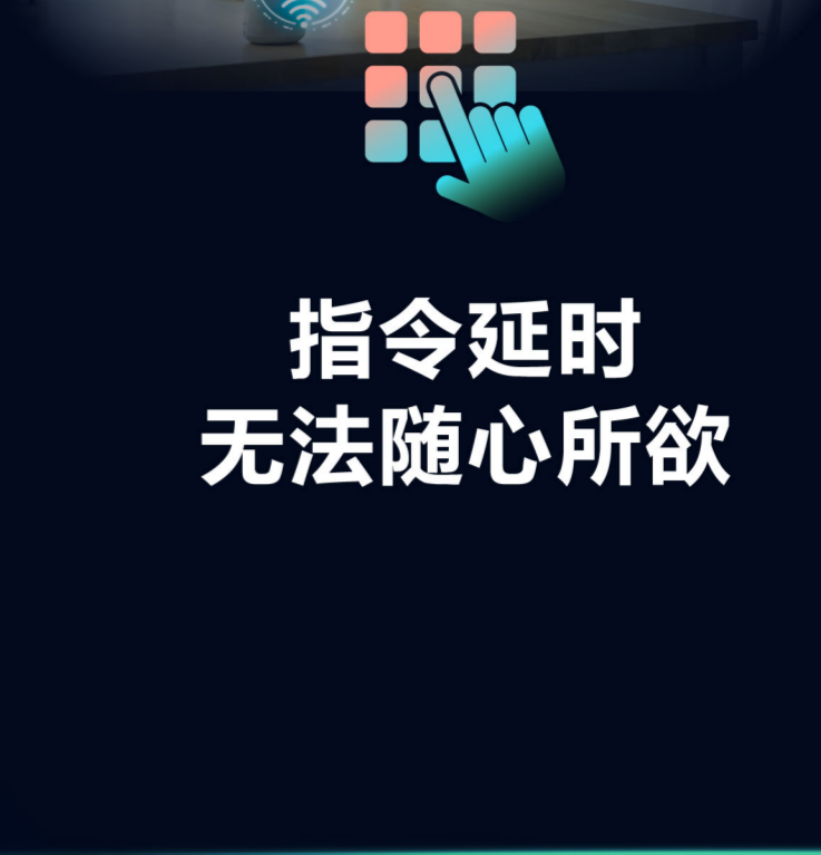
指令延时 无法随心所欲